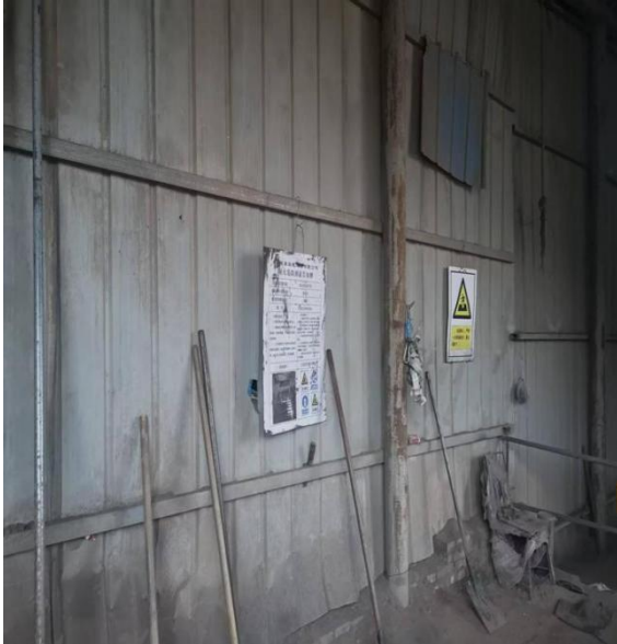
图 5 《较大危险因素告知牌》