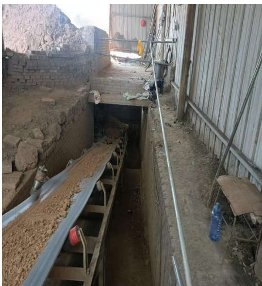
图 3 堆土场及皮带机照片

2.3 米左右，在土方与挡墙交接处有一处塌料孔，孔径约 1.2 米。见图 3、图 4。