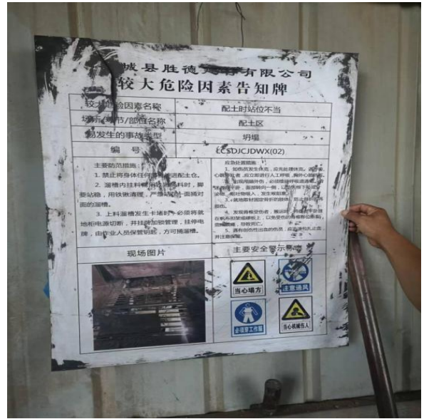
图 6 《较大危险因素告知牌》