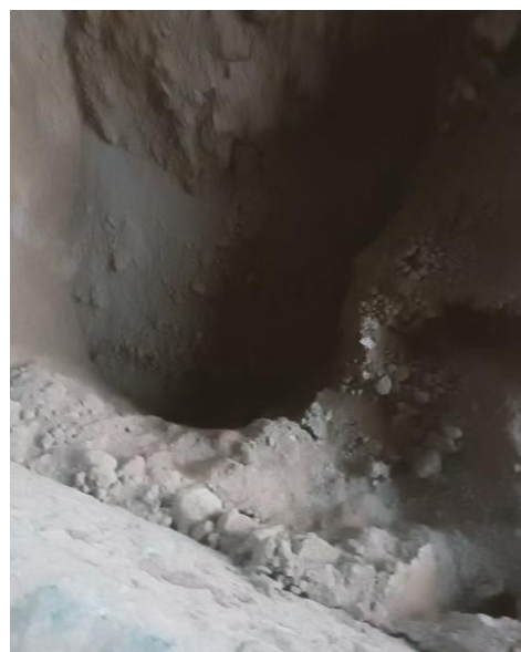
图 4 堆土坑

3.堆土场西侧彩板围墙上悬挂有《较大危险因素告知牌》一块、安全带一条、《较大危险因素告知牌》内容显示危险名称：配土时站位不当；易发生安全事故类型：坍塌；主要安全防范措施：（1）禁止将身体任何部位伸进配土仓。（2）溜槽内挂料需用铁锹清理捅料时，脚要站稳，用铁锹清理，严禁站到一面捅对面的溜槽。（3）上料溜槽发生卡堵时，必须将就地柜电源切断，