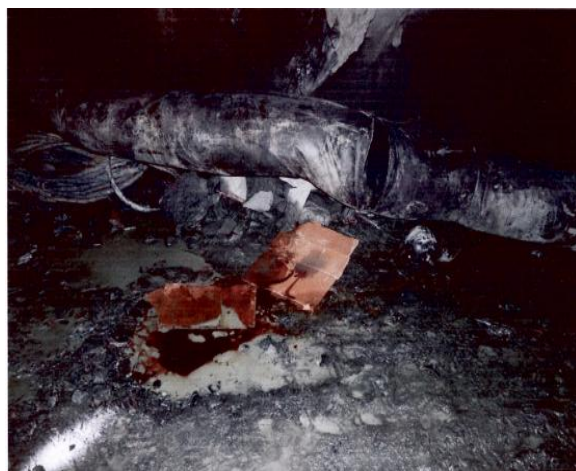
掉落地面的风筒布及破损情况