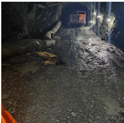
图 1 事故现场照片

2024 年 5 月 3 日 7 时 50 分，黎瑞井巷公司裴 xx、李 xx、芦 xx 和程 xx 四人参加班前会后入井。11 时 14 分，裴 xx、李 xx、芦 xx 和程 xx 到 580 米水平 6 穿穿脉口进行铲运作业。12 时 50 分许，裴 xx、程 xx 将风筒延伸至下盘探矿巷口后，继续进行铲运作业。13 时许，芦 xx 驾驶 6 号车驶入 6 穿下盘探矿巷口，铲车司机裴 xx 为其装矿时，发现芦 xx 不在车上，便叫李 xx 操作 6 号车配合装车，完毕后让李 xx 寻找芦 xx。13 时 10 分许，李 xx 在离出口约两三米处，发现一人躺在 6 穿与主运输巷交叉口靠近风筒布处，走近一看是芦 xx，其头部有血，并安全帽破裂、帽壳与帽带分离，顺手扔掉帽壳开始呼唤，芦 xx 没有应答，然后呼叫铲车司机裴 xx。（图 1 和图 2）