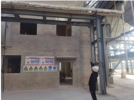
事故人员坠落地点（图二）